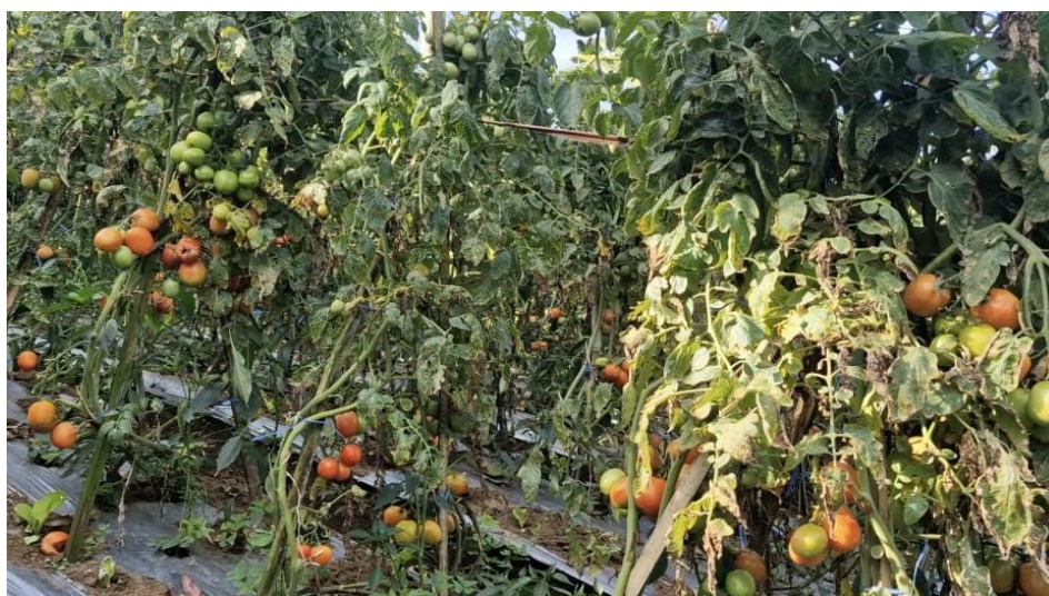
Gambar 3. Kondisi tomat yang tidak dipanen