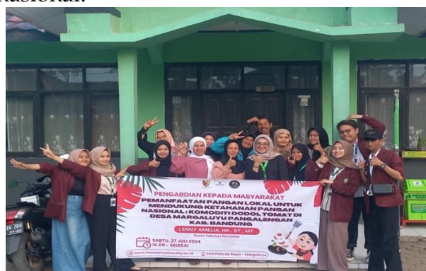
Gambar 5. Foto bersama peserta penyuluhan

Secara keseluruhan, kegiatan pelatihan dan evaluasi ini tidak hanya memperkuat kapasitas produksi dan pemasaran dodol tomat, tetapi juga menyiapkan masyarakat untuk menghadapi tantangan pasar dengan lebih baik. Rencana tindak lanjut yang mencakup pelatihan lanjutan dan pemantauan berkelanjutan diharapkan dapat memastikan keberlanjutan dan pertumbuhan yang berkelanjutan dari inisiatif ini, mendukung pengembangan ekonomi lokal dan ketahanan pangan nasional.