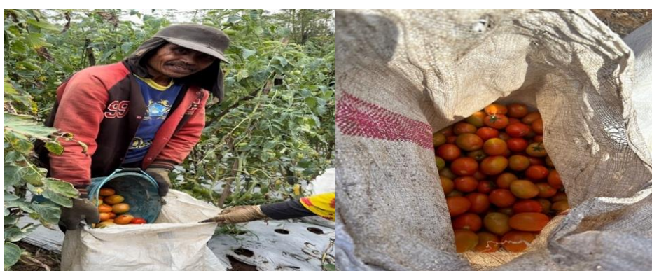
Gambar 2. Kegiatan panen petani tomat