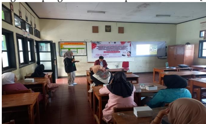
Gambar 4. Penyampaian materi penyuluhan

Penyampaian materi penyuluhan yang dilaksanakan memberikan kontribusi signifikan terhadap peningkatan kapasitas produksi dodol tomat. Melalui materi yang disampaikan, baik secara verbal maupun melalui video, peserta mendapatkan wawasan yang lebih dalam mengenai teknik pengolahan tomat, mulai dari pemilihan bahan baku yang berkualitas hingga proses pengolahan yang benar untuk menghasilkan produk dodol tomat dengan standar tinggi.