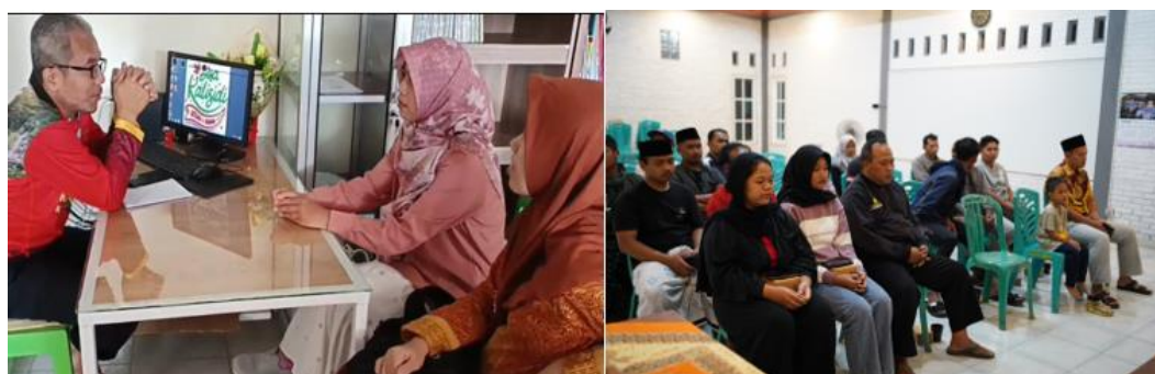
Gambar 4. Dokumentasi Kegiatan Pelatihan

Pelatihan yang dipilih dalam program pengabdian ini adalah Pelatihan Kemampuan Manajemen Bisnis dan Keuangan BUMDes Kaya Guna, yang didefinisikan sebagai rangkaian kegiatan pembelajaran terstruktur untuk meningkatkan pemahaman konseptual dan keterampilan praktis pengurus dalam mengelola unit usaha BUMDes secara profesional, akuntabel, dan berkelanjutan. Pelatihan ini mencakup penyusunan analisis kelayakan usaha ( Break Even Point , Return on Investment , dan Payback Period ), serta penguatan pencatatan dan pelaporan keuangan berbasis SAK ETAP dengan dukungan aplikasi komputer akuntansi sederhana.