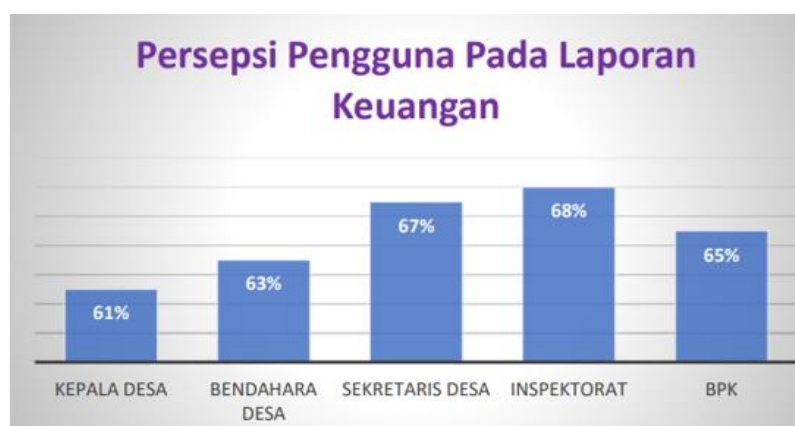
Gambar 2. Persepsi Pengguna Laporan Keuangan BUMDes Kaya Guna pada Laporan Keuangan 2024

Permasalahan yang diidentifikasi sejalan dengan temuan yang lebih luas dalam literatur yang menekankan pentingnya kompetensi manajerial dan akuntabilitas keuangan dalam memastikan keberhasilan usaha perdesaan [14]. Konsep tata kelola desa yang baik juga menggarisbawahi pentingnya transparansi, akuntabilitas, partisipasi, dan responsivitas dalam mengelola BUMDes untuk membangun kepercayaan publik dan memastikan penggunaan sumber daya yang efektif [8], [10]. Selain itu, Standar Akuntansi Keuangan Badan Usaha Tanpa Akuntabilitas Publik (SAK ETAP) menyediakan kerangka kerja akuntansi yang disederhanakan dan sesuai untuk BUMDes, yang memungkinkan pengurus dapat menyusun laporan keuangan yang memenuhi standar akuntabilitas dasar dengan mempertimbangkan keterbatasan sumber daya organisasi.