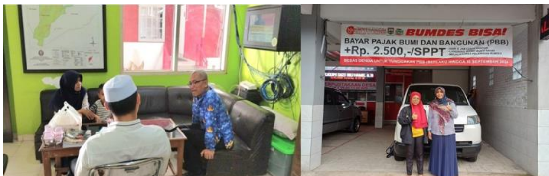
Gambar 3. Dokumentasi Koordinasi dengan Pemerintah Desa dan Direktur BUMDes

kebutuhan BUMDes Kaya Guna, sekaligus menggali harapan peserta terhadap program. Pendekatan yang digunakan menekankan pada partisipasi aktif, sehingga sejak awal pengurus BUMDes tidak hanya diposisikan sebagai penerima manfaat, tetapi juga sebagai mitra yang terlibat dalam perencanaan dan pelaksanaan.