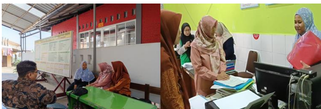
Gambar 5. Kegiatan Pendampingan

Urgensi tahap ini terletak pada transformasi pengetahuan konseptual menjadi keterampilan aplikatif. Sebelumnya, pengurus BUMDes cenderung menggunakan intuisi dalam pengambilan keputusan bisnis. Melalui simulasi analisis kelayakan, peserta memahami pentingnya perhitungan rasional terhadap biaya, pendapatan, dan margin usaha. Dengan adanya pengenalan kegiatan ini, peserta tidak hanya memahami manfaat program, tetapi juga terdorong untuk berpartisipasi aktif dalam seluruh rangkaian pelatihan.