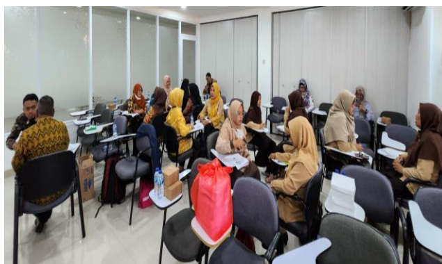
Gambar 2. Peserta sedang melakukan praktik konseling