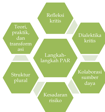
Gambar 1. Langkah-langkah PAR

PAR dianggap sebagai bagian dari penelitian tindakan, yang merupakan pengumpulan dan analisis data sistematis untuk tujuan mengambil tindakan dan membuat perubahan dengan menghasilkan pengetahuan praktis [9]. Idealnya, tujuan dari semua penelitian tindakan adalah untuk memberikan perubahan sosial, dengan tindakan spesifik (atau tindakan) sebagai tujuan akhir [10]. Keutamaan pendekatan ini yaitu penerapan riset yang bersamaan dengan partisipasi aktif dari semua pihak yang terkait. PAR merupakan jenis penelitian kualitatif yang mengintegrasikan metode dan teknik mengamati, mendokumentasikan, menganalisis, dan menafsirkan karakteristik, pola, atribut, dan makna fenomena manusia yang diteliti.[9]