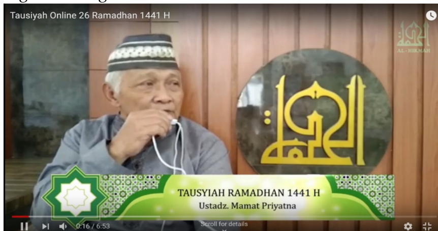
Gambar 3. Tampilan Konten Tausiyah