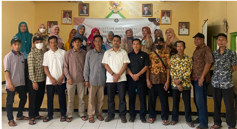
Gambar 4. Peserta Pelatihan

Setelah pelaksanaan pelatihan masyarakat Desa Cibungur yang diwakili oleh perangkat desa, tokoh masyarakat dan orang tua yang memiliki anak kecil/remaja bisa lebih memahami pentingnya peran orang tua bagi anak-anak dalam penggunaan internet .