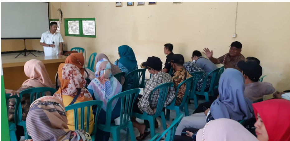
Gambar 3. Penyampaian Materi dan Tanya Jawab

Materi yang disampaikan pada saat sosialisasi berlangsung diantaranya: