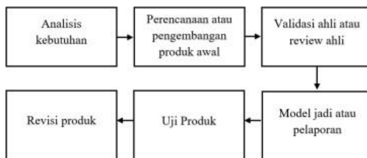
Gambar 1. Prosedur

Penelitian Pengembangan Populasi yang ditentukan oleh peneliti ialah siswa SMP Negeri 8 Cilegon Banten. Pengambilan sampel dengan non-probability sampling yang bagi Sugiyono (2001) ialah metode dimana tiap anggota dari populasi tidak mempunyai kesempatan yang sama buat diseleksi jadi sampel. Metode dalam non-probability sampling yang peneliti pakai dengan memakai purposive sampling . Menurut Sugiyono (2014) purposive sampling adalah teknik penentuan sampel dengan pertimbangan tertentu. Dengan meminta ahli materi dan media menilai kelayakan produk menjadi cara untuk melakukan evaluasi, hal demikian disebut dengan uji alpha. Adapun uji beta merupakan bentuk uji kelayakan produk berdasarkan penilaian calon pengguna terhadap produk yang dikembangkan. Instrumen riset yang digunakan yakni angket buat validasi kelayakan media layanan data strategi belajar buat pakar materi serta pakar media serta angket asumsi siswa. Dengan mengacu pada kisi-kisi instrumen yang sudah terbuat hingga butir-butir instrumen dapat disusun, setelah itu dinilai serta dievaluasi judgment .