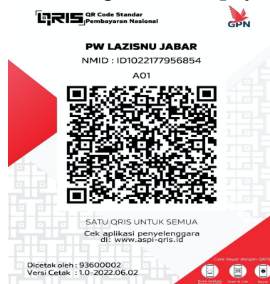
Gambar 5. QRIS Pembayaran Zakat, Infaq dan Shadaqah

Tidak hanya kemudahan transaksi zakat, bersama layanan virtual yang juga akan hadir juga QR Code atau QRIS, dengan adanya QR Code ini lebih memudahkan muzakki dan munfiq dalam berzakat maupun berinfaq dari manapun melalui payment M-Banking, OVO, Gopay, Dana, Shopee dan lainnya.