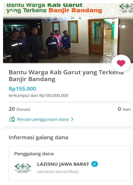
Gambar 4. LAZISNU Jawa Barat bekerja sama dengan Crowdfunding kitabisa.com

Tidak hanya kemudahan transaksi zakat, bersama layanan virtual yang juga akan hadir juga QR Code atau QRIS, dengan adanya QR Code ini lebih memudahkan muzakki dan munfiq dalam berzakat maupun berinfaq dari manapun melalui payment M-Banking, OVO, Gopay, Dana, Shopee dan lainnya.